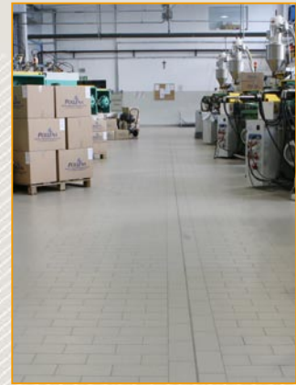
Produktions- und Lagerhallen