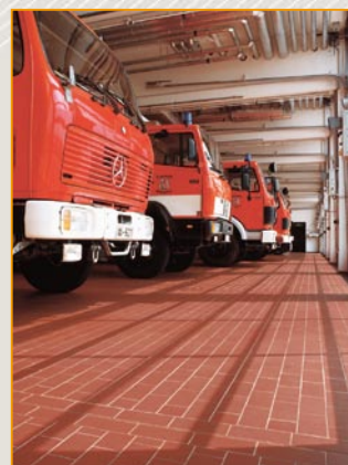
Fußboden hergestellt aus Argelith-Platten