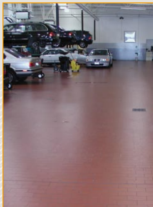
Fußboden hergestellt aus Argelith-Platten