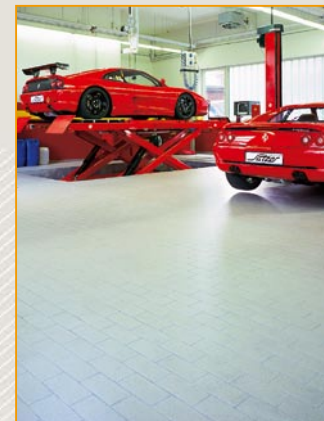
Fußboden hergestellt aus Argelith-Platten