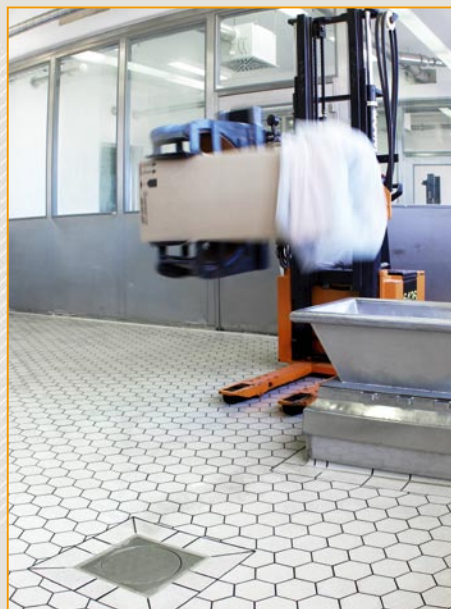
▲ przemysł farmaceutyczny posadzka wykonana z płytek Argelith