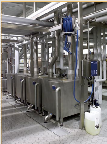
▲ przemysł spożywczy posadzka wykonana z płytek Argelith