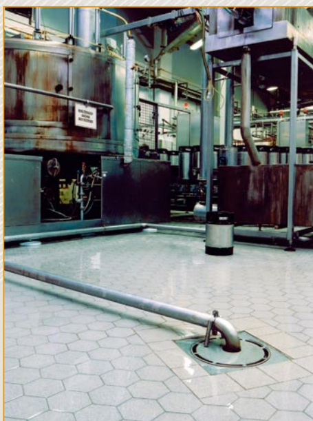
▲ zakłady chemiczne posadzka wykonana z płytek Argelith