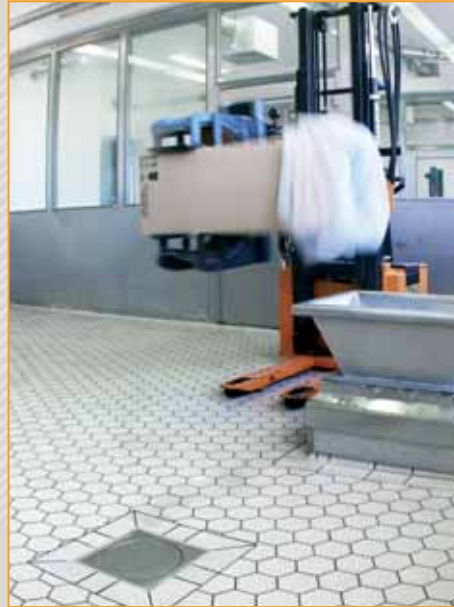
▲ przemysł farmaceutyczny posadzka wykonana z płytek Argelith