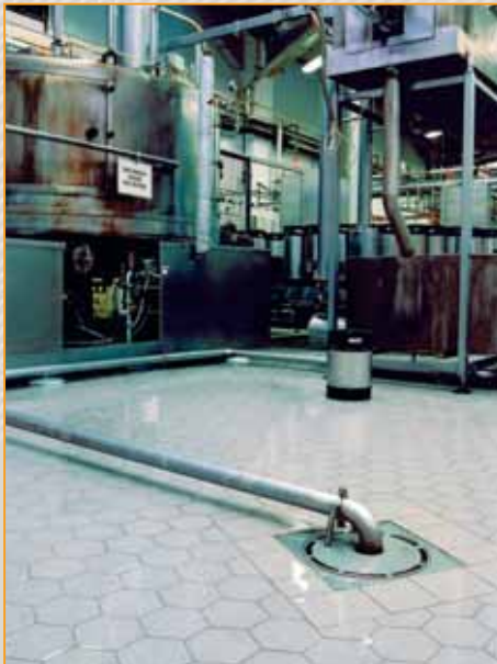
▲ zakłady chemiczne posadzka wykonana z płytek Argelith